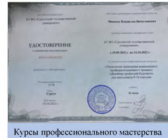
Курсы профессионального мастерства