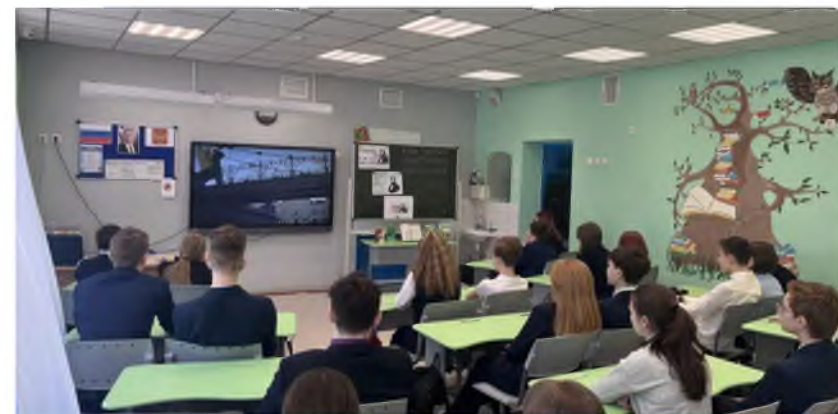
Киноклуб, посвященный 200-летию со Дня рождения К.Д. Ушинского