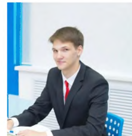
Выступление на ГМО классных руководителей