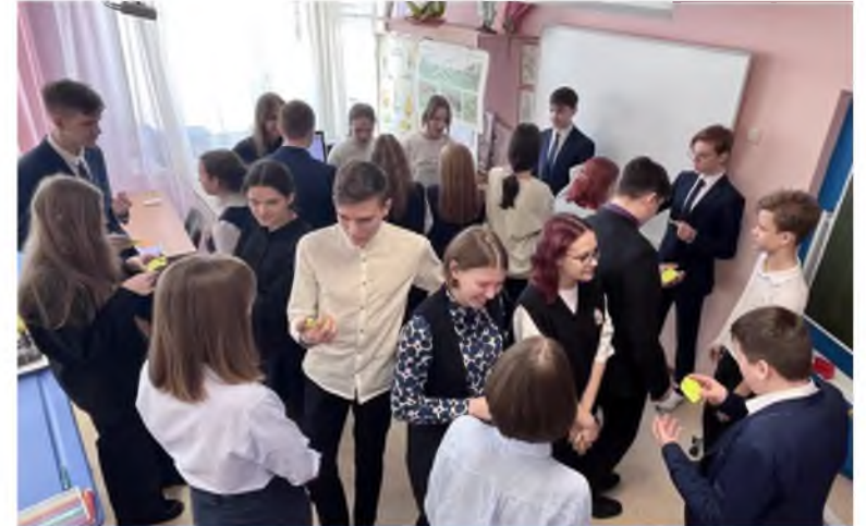
Мастер-класс «Сингапурские структуры от А до Я»