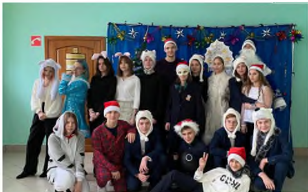
Реализация плана воспитательной работы