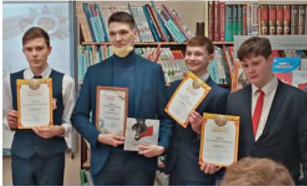
Квиз «Я помню! Я горжусь» (Совместно с Советом ветеранов г. Югорска)