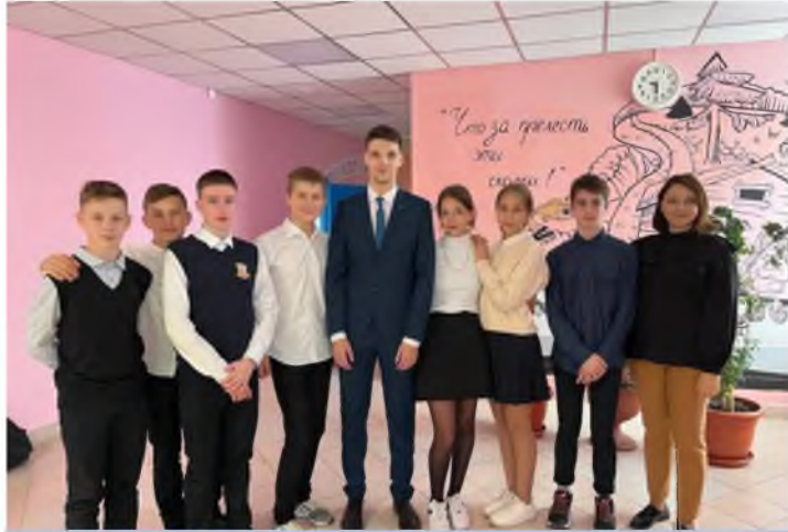
Открытые просмотры образовательной деятельности