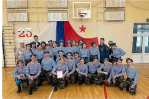
Смотр строя и песни – 2023 (победители)