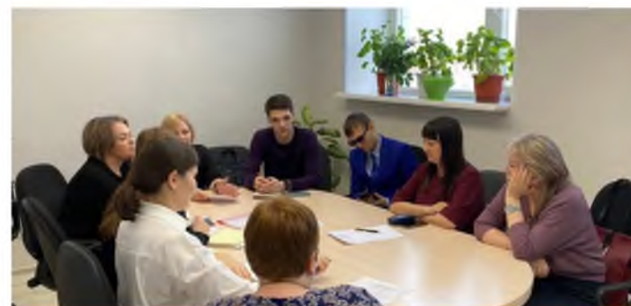
Заседание ГМО учителей истории и обществознания