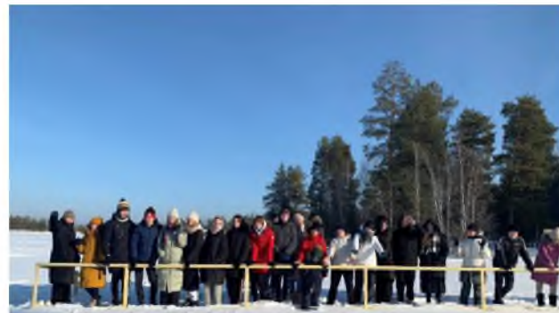
Взаимодействие с родителями «Классные сборы» (ДОЛ «Окуневские зори»)