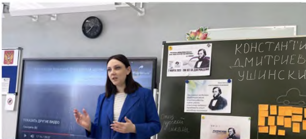
Мастер-класс «Организация воспитательного события в школе»