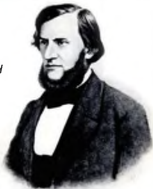
Константин Дмитриевич Ушинский

Наставник не должен гордиться своим опытом работы, нужно уметь опытному педагогу передавать опыт молодому поколению